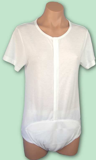
※写真は「百花」の下におむつを着用した状態です